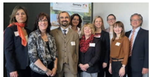
04-2015 Турне Destination Germany, Северная Америка