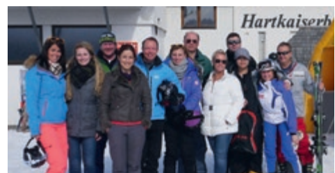
03-2015 Креативный воркшоп авиакомпании Люфтганза – LH Mountain Hub Kreativworkshop