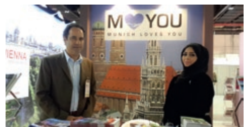
03-2015 Шoy Bride Show, Дубай