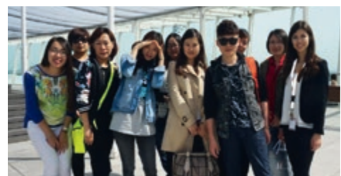
05-2015 Ознакомительный тур Air China