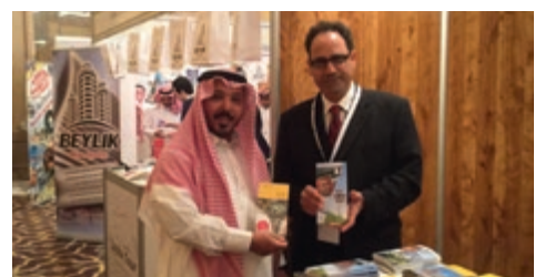
04-2015 Туристическое шоу, Эр-Рияд