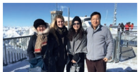
03-2015 Ознакомительный тур Mahan Air, Китай