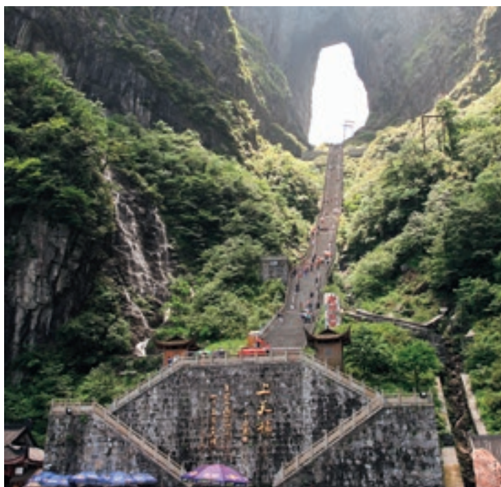
«К «Небесным вратам» горы Тяньмэньшань ведет путь из 999 крутых каменных ступенек.