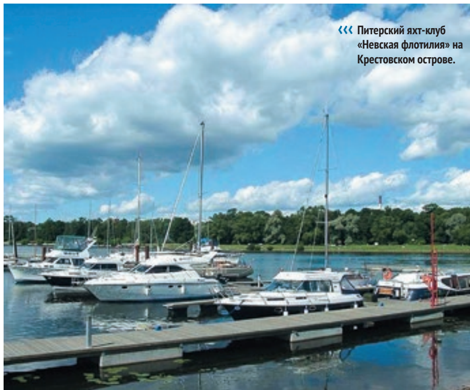
<<< Питерский яхт-клуб «Невская флотилия» на Крестовском острове.