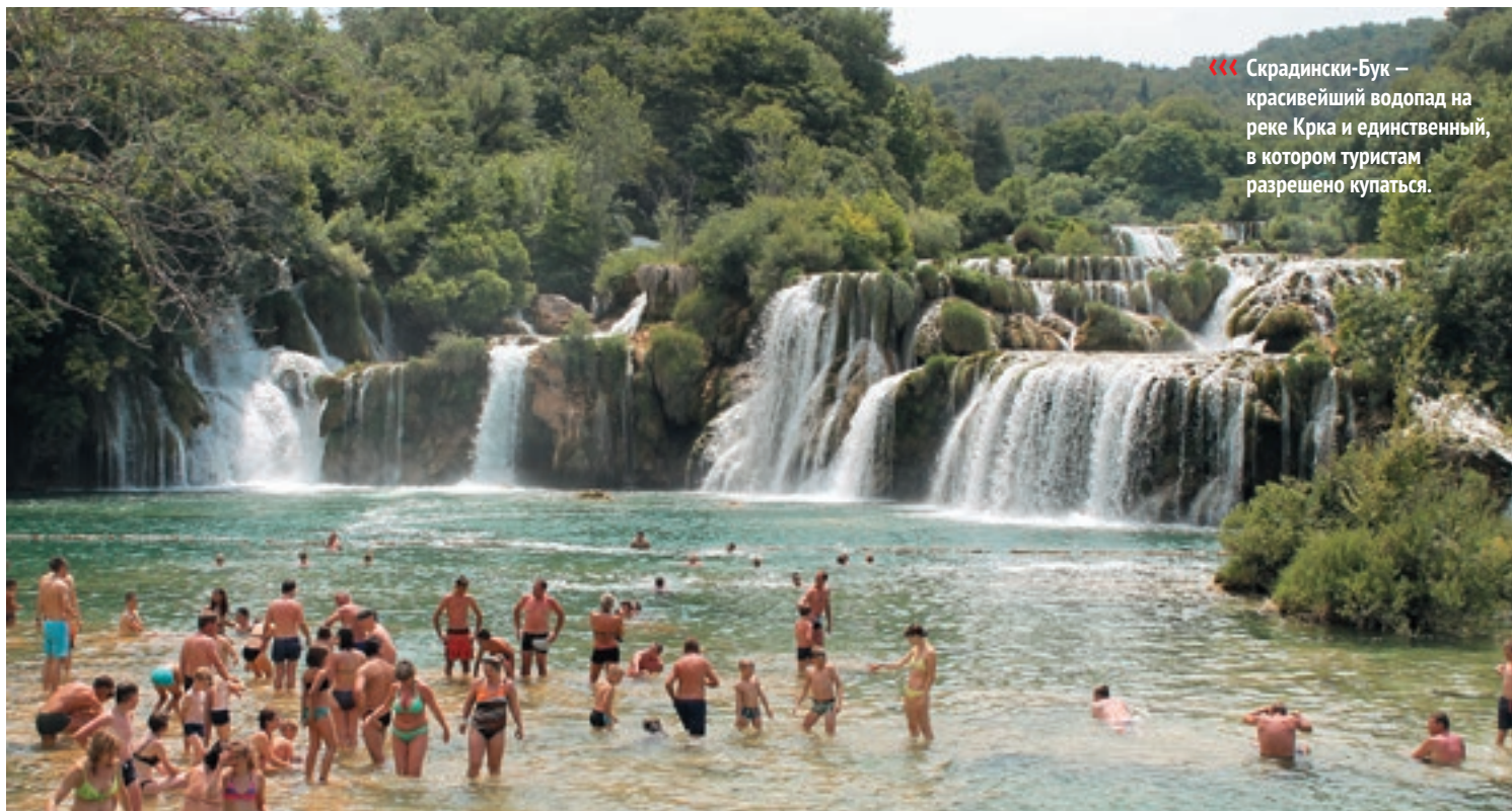
«« Скрадински-Бук – красивейший водопад на реке Крка и единственный, в котором туристам разрешено купаться.