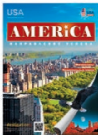
«Америка. Направление успеха. Мегалополисы и национальные парки»

Партнёр: Баварская туристическая организация Bavaria Tourism