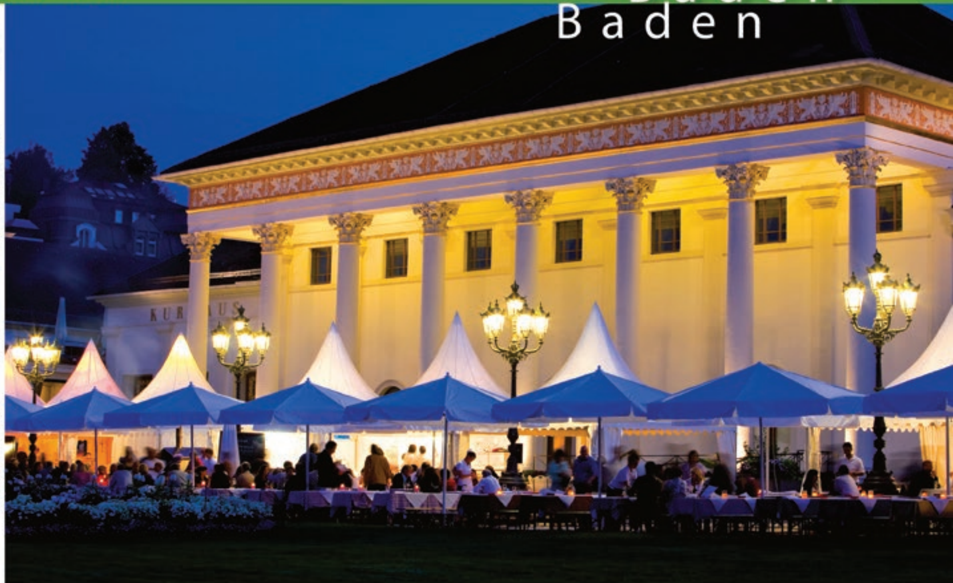
Большая фотография справа Курзал Баден-Баден – общественный центр города; сверху слева Термы Каракалла – в числе красивейших терм Европы; сверху справа Вид на «средиземноморские» пейзажи Баден-Бадена; внизу слева Казино Баден-Бадена, крупнейший и старейший игровой дом Германии; внизу справа Международные охотки Баден-Баден/Иффенхайм

Компетентность на высшем уровне – профессиональные клиники с отличной репутацией предлагают гостям со всего мира медицинские обследования, комплексные медицинские консультации, а также необходимые хирургические вмешательства.