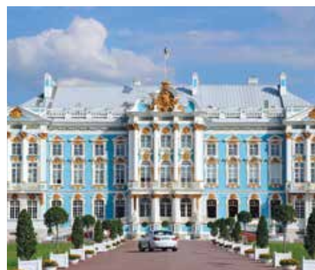
Екатерининский дворец в Царском селе