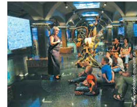
Музейный комплекс «Вселенная воды»

Санкт-Петербург, ул. Шпалерная, д. 56 (ст. м «Чернышевская») www.vodokanal-museum.ru