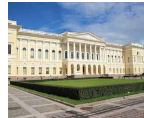
Государственный Русский музей