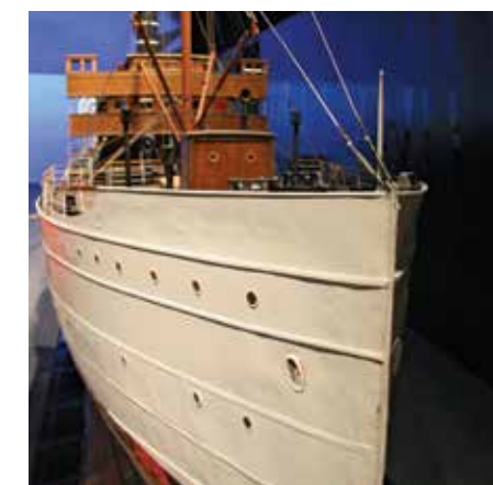
Центральный военно-морской музей

Тел.: +7 (812) 303-85-13 (заказ экскурсий), www.navalmuseum.ru