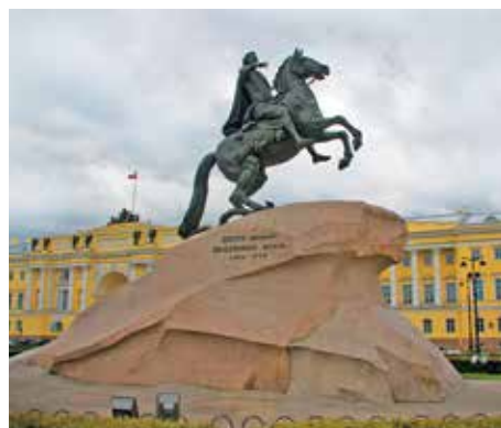
«Медный всадник» на Сенатской площади