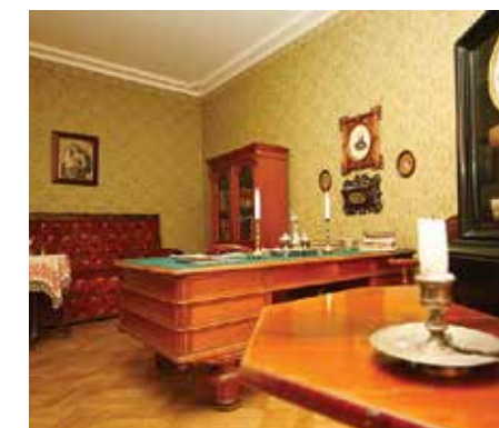
Мемориальный музей-квартира Ф. М. Достоевского

Тел.: +7 (812) 571-40-31, +7 (921) 977-43-00, www.md.spb.ru