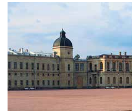
Государственный художественно-архитектурный дворцово-парковый музей-заповедник «Гатчина»