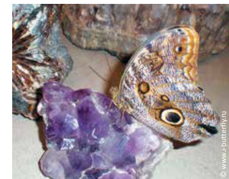
Музей живых бабочек «Тропический рай»

Санкт-Петербург, Большой пр. Петроградской стороны, д. 18А www.freud.ru