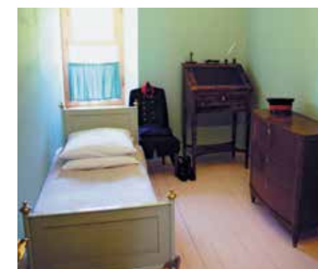
Комната А.С. Пушкина в Музее-лицее