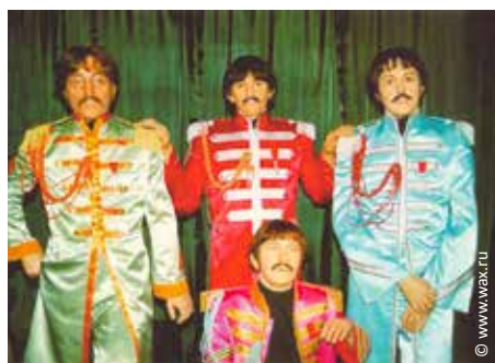
Музей восковых фигур

Санкт-Петербург, Большой Гостиный Двор, Перинная линия, 2 этаж, галерея www.wax.ru