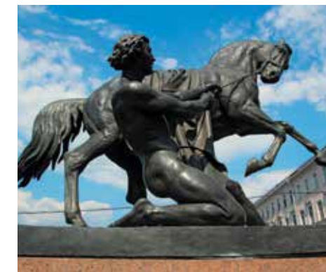
Скульптурная группа П. Клодта «Укрощение коня человеком»