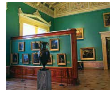
Государственный Русский музей