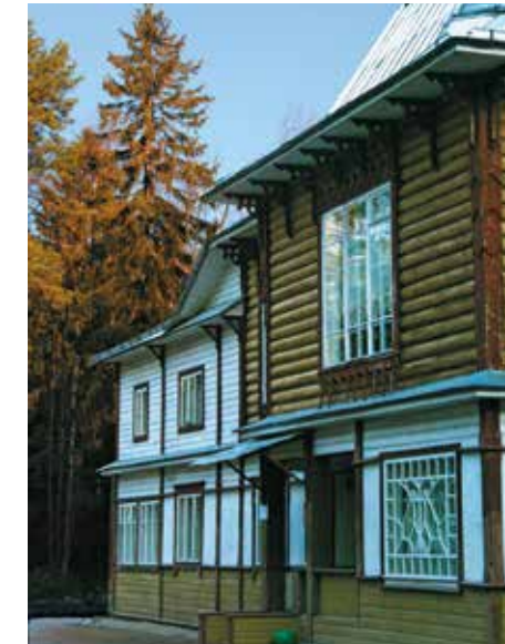
Музей-усадьба И.Е. Репина «Пенаты»

» Академический театр оперы и балета им. М.П. Мусоргского – Михайловский театр Пл. Искусств, д. 1 Тел.: +7 (812) 595-43-05, 595-43-19 www.mikhailovsky.ru