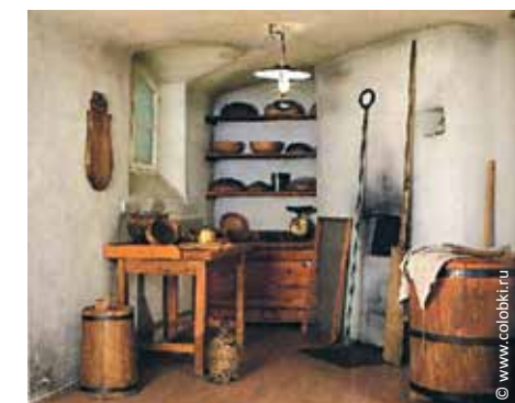
Санкт-Петербургский музей хлеба

Санкт-Петербург, Лиговский просп., д. 73 www.colobki.ru