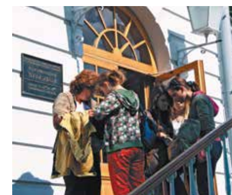
Музей-лицей в Царском селе