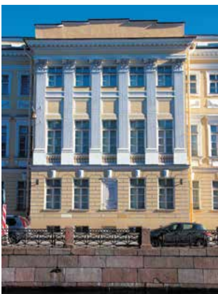
Музей-квартира А.С. Пушкина

Тел.: +7 (812) 230-64-31, www.spbmuseum.ru