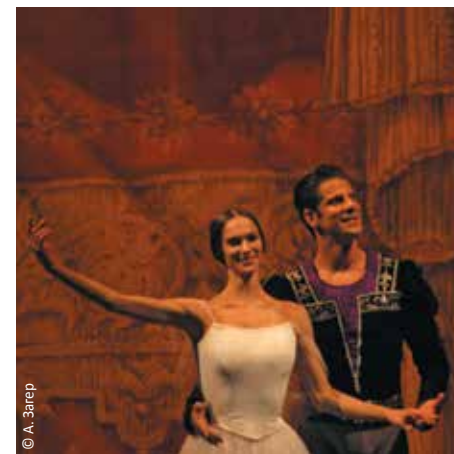
Звезды мирового балета Полина Семионова и Марсело Гомес на сцене Михайловского театра.

» Академический Большой драматический театр им. Г.А. Товстоногова Наб. реки Фонтанки, д. 65 Тел.: +7 (812) 310-92-42, 244-59-04 www.bdt.spb.ru