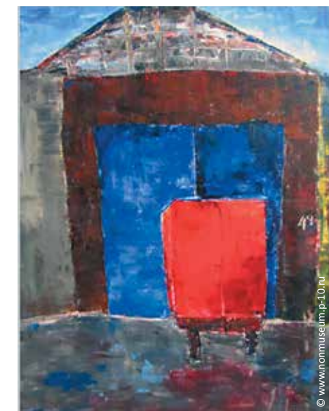
Музей нонконформистского искусства

Музей нонконформистского искусства – это выставочный, научный и архивный центр по изучению и пропаганде нонконформистского искусства, а также современного искусства России, Европы и Америки. Музей ведет активное сотрудничество с ведущими выставочными площадками и музеями как Санкт-Петербурга (Государственный Эрмитаж, Государственный Русский музей, Государственный музей истории Санкт-Петербурга и др.), так и с музеями и галереями других городов России (Москва, Петрозаводск, Великий Новгород), Финляндии, Швеции, США. Санкт-Петербург, ул. Пушкинская, д. 10 www.nonmuseum.p-10.ru