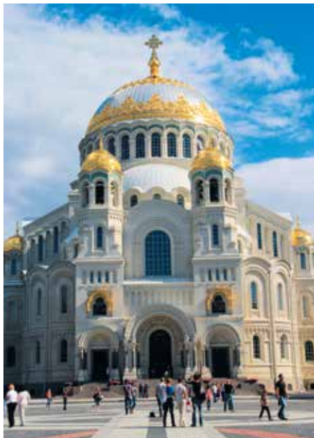
Морской собор святителя Николая Чудотворца в Кронштадте