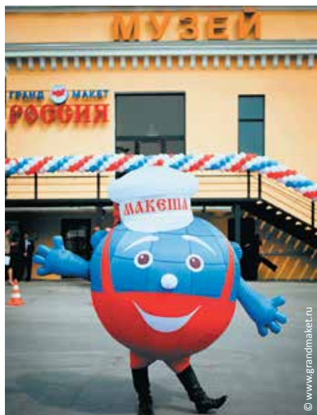
«Гранд Макет Россия»