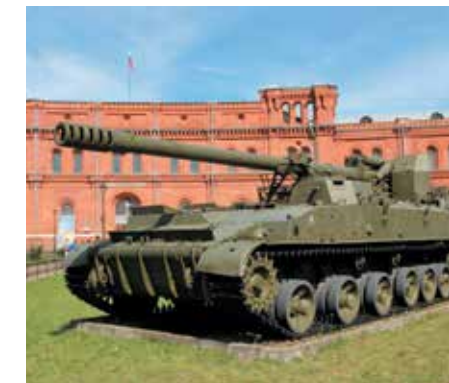
Военно-исторический музей артиллерии, инженерных войск и войск связи