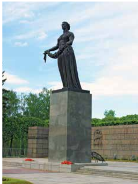
Пискаревское мемориальное кладбище