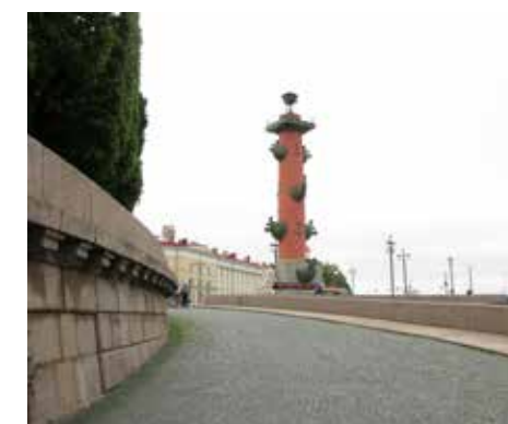
Стрелка Васильевского острова

Открыт в июле 2000 г. на Итальянской улице (ст. м. «Гостиный двор», «Невский проспект»). Памятник представляет собой фигуру Остапа Бендера, опирающегося на стул работы Гамбса. На стул может присесть любой желающий.