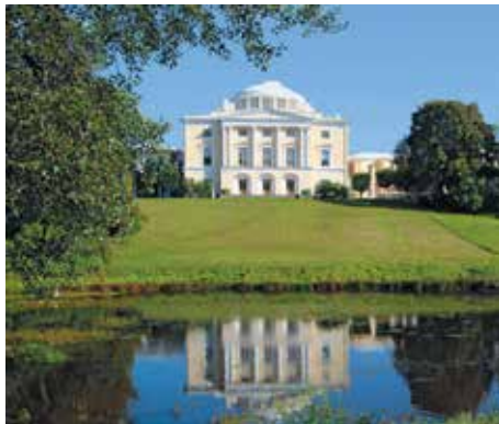
Государственный художественно-архитектурный дворцово-парковый музей-заповедник «Павловск»