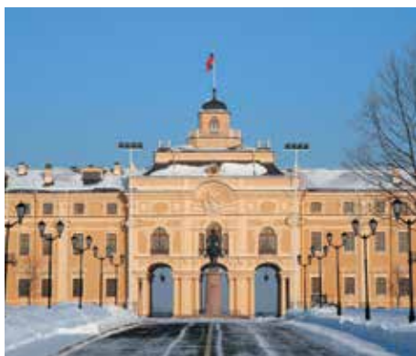
Константиновский дворец в Стрельне

г. Кронштадт, Якорная пл., д. 1 www.kronstadt.ru