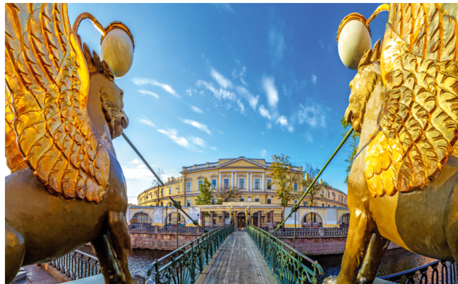
ОФИЦИАЛЬНЫЙ ТУРИСТИЧЕСКИЙ ПОРТАЛ VISIT-PETERSBURG.RU