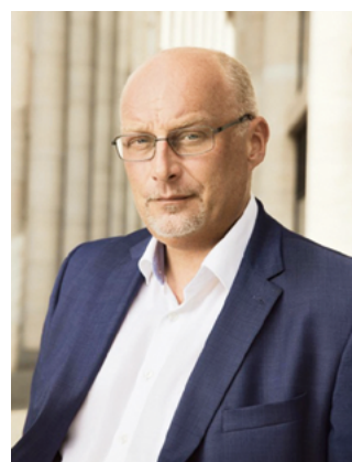
СЕРГЕЙ КОРНЕЕВ, ПРЕДСЕДАТЕЛЬ КОМИТЕТА ПО РАЗВИТИЮ ТУРИЗМА САНКТ-ПЕТЕРБУРГА

О новых вызовах и новых планах рассказывает председатель Комитета по развитию туризма Санкт-Петербурга Сергей КОРНЕЕВ