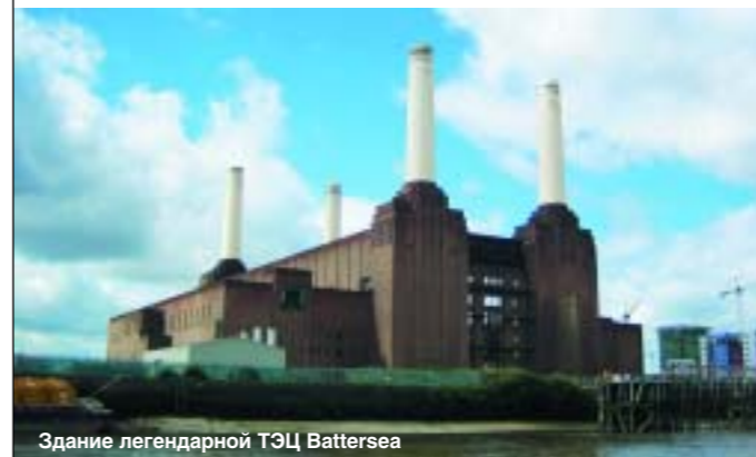
Здание легендарной ТЭЦ Battersea

Интерес представляют не только художественные галереи Лондона, но и научные музеи с разнообразными экспонатами. Любят в Лондоне и небольшие дома-музеи , где раньше жили лондонские знаменитости или даже созданные ими герои.