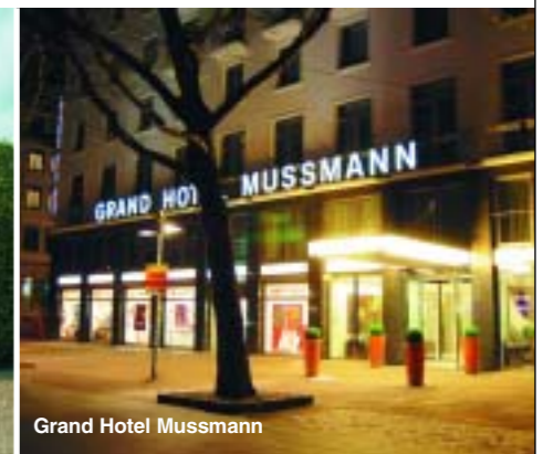
Grand Hotel Mussmann