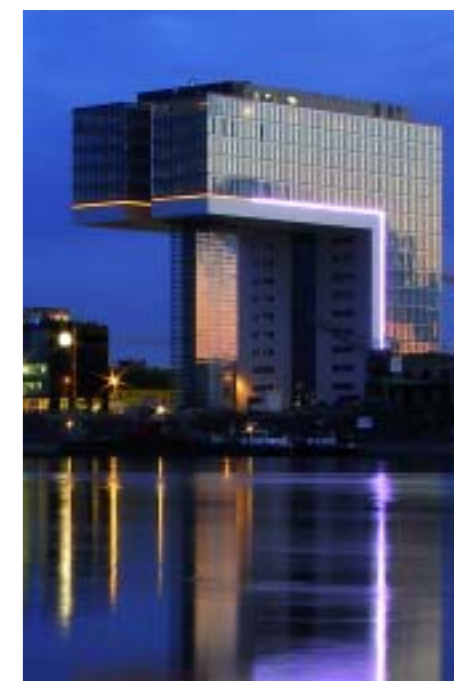
«Дом-кран» в районе Райнауафен

С выдающимися архитектурными памятниками древности в Кёльне прекрасно уживаются современные строения: так, в районе Райнауафен (Rheinauhafen) на берегу Рейна возник новый городской квартал с потрясающими зданиями, как будто бы нависающими над рекой (их называют «домами-кранами» за внешнюю схожесть со строительными кранами), здесь же – новые рестораны, кафе и культурные учреждения.