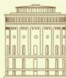
Hotel im Wasserturm

Особый стиль. Превосходные номера Ресторан La Vision, увенчанный двумя звездами Мишлена