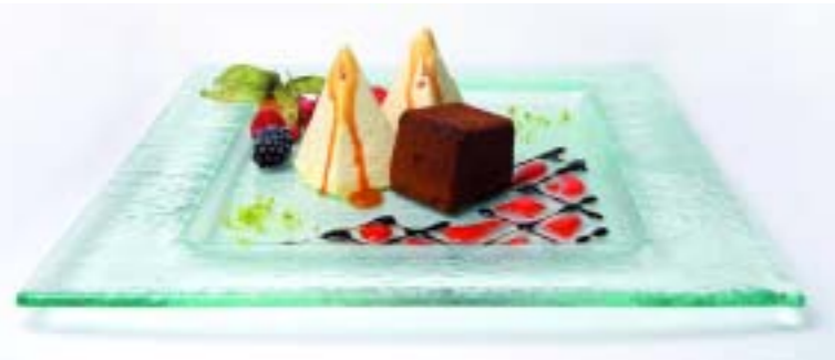
Рождественский базар Энгель Ноймаркт

привлекают фестиваль кёльнских экскурсоводов Expedition Colonia и гигантский фейерверк Koelner Lichter. Он состоится 14 июля 2012 г. В 2012 г. с 5 по 19 августа в Кёльне также пройдет крупнейшая выставка компьютерных игр Gamescom. И это далеко не всё.