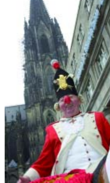
© J. Badura, KölnFestkomitee Kölnner Karneval

снежном теплоходе. Самый большой и современный флот имеет круизная компания KD («белый флот на Рейне»). KD (Köln-Düsseldorfer Deutsche Rheinschiffahrt AG) – лидер в области пассажирских перевозок по Рейну, ее белые корабли более 180 лет перевозят пассажиров по Рейну, Майну и Мозелю. KD – старейшее акционерное общество в Германии и самый опытный речной пассажирский перевозчик в мире. Кроме регулярных перевозок, которые длятся от Пасхи до конца октября, KD предлагает увлекательные речные про-