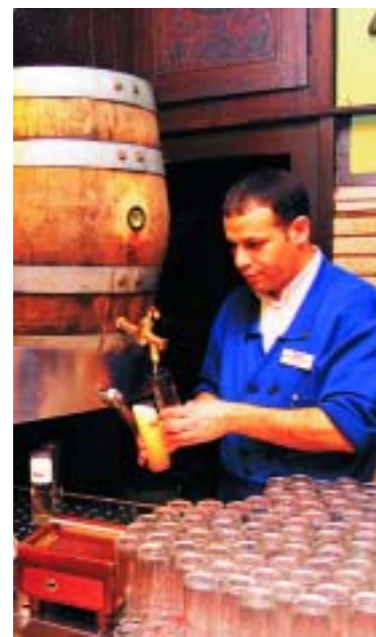
На пивоварне «Кельш»

Многочисленные торговые пассажи, галереи, целые улицы с отличными магазинами приглашают в увлекательное путешествие за покупками. В центре города всё рядом. Знаменитая торговая