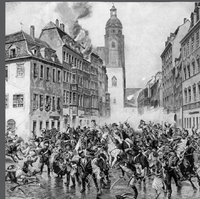
Наполеон Бонапарт покидает Лейпциг утром 19 октября 1813. Литография второй половины XIX в.