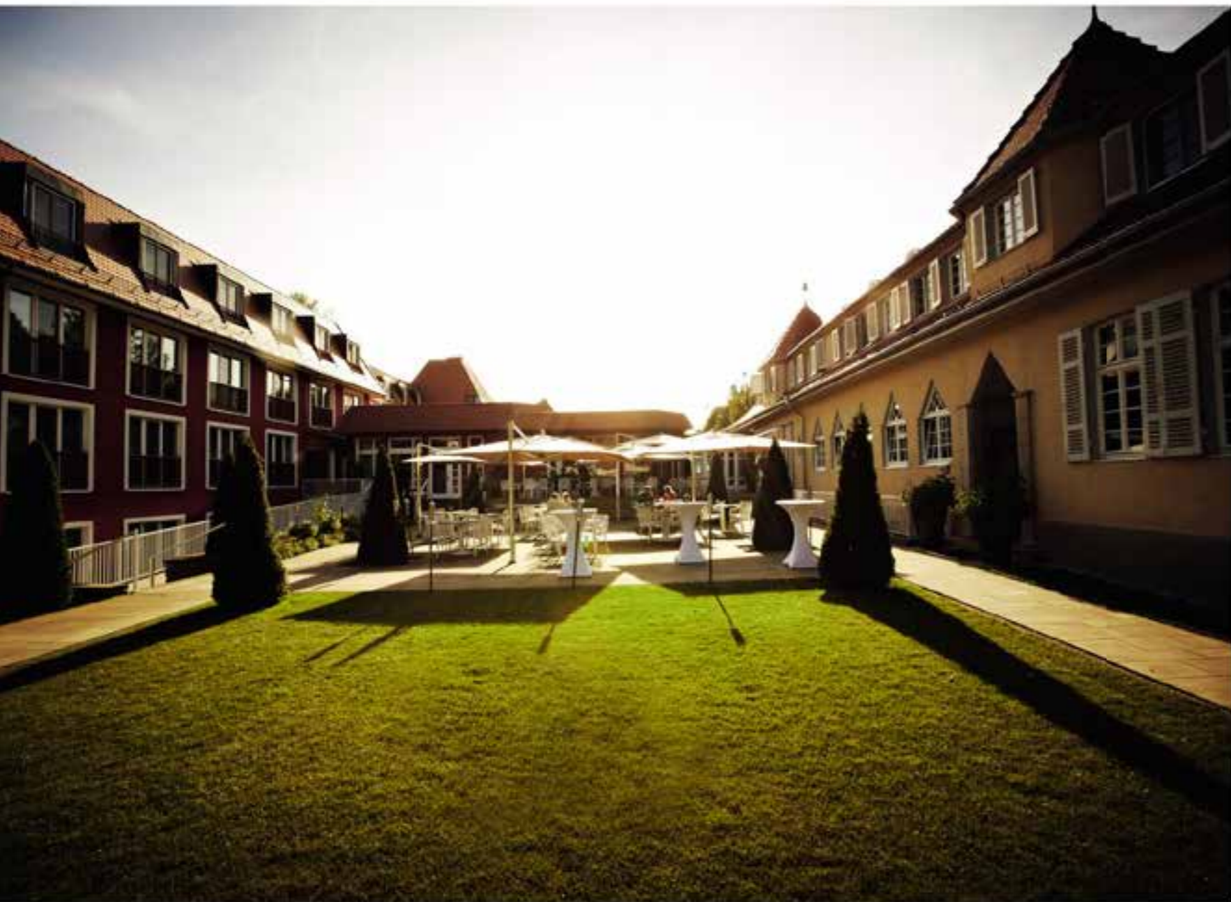
Солнечное начало дня в отеле Waldhotel в Штутгарте