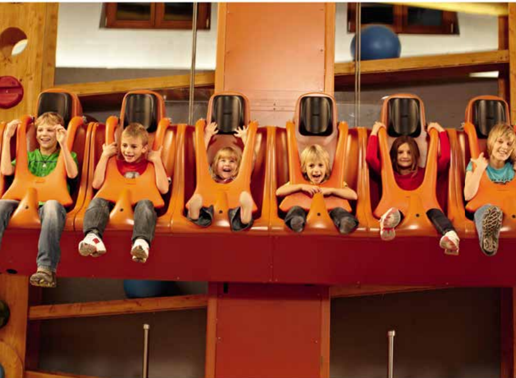
Удовольствие для детей и взрослых в парке развлечений Трипсдрилл