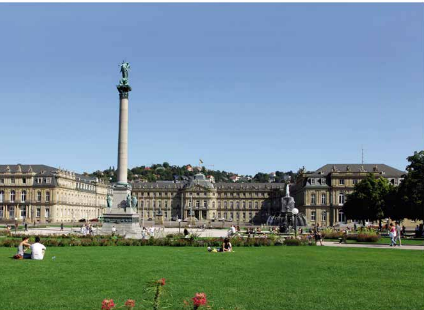
Отдохните в центре Штутгарта на площади Шлоссплац