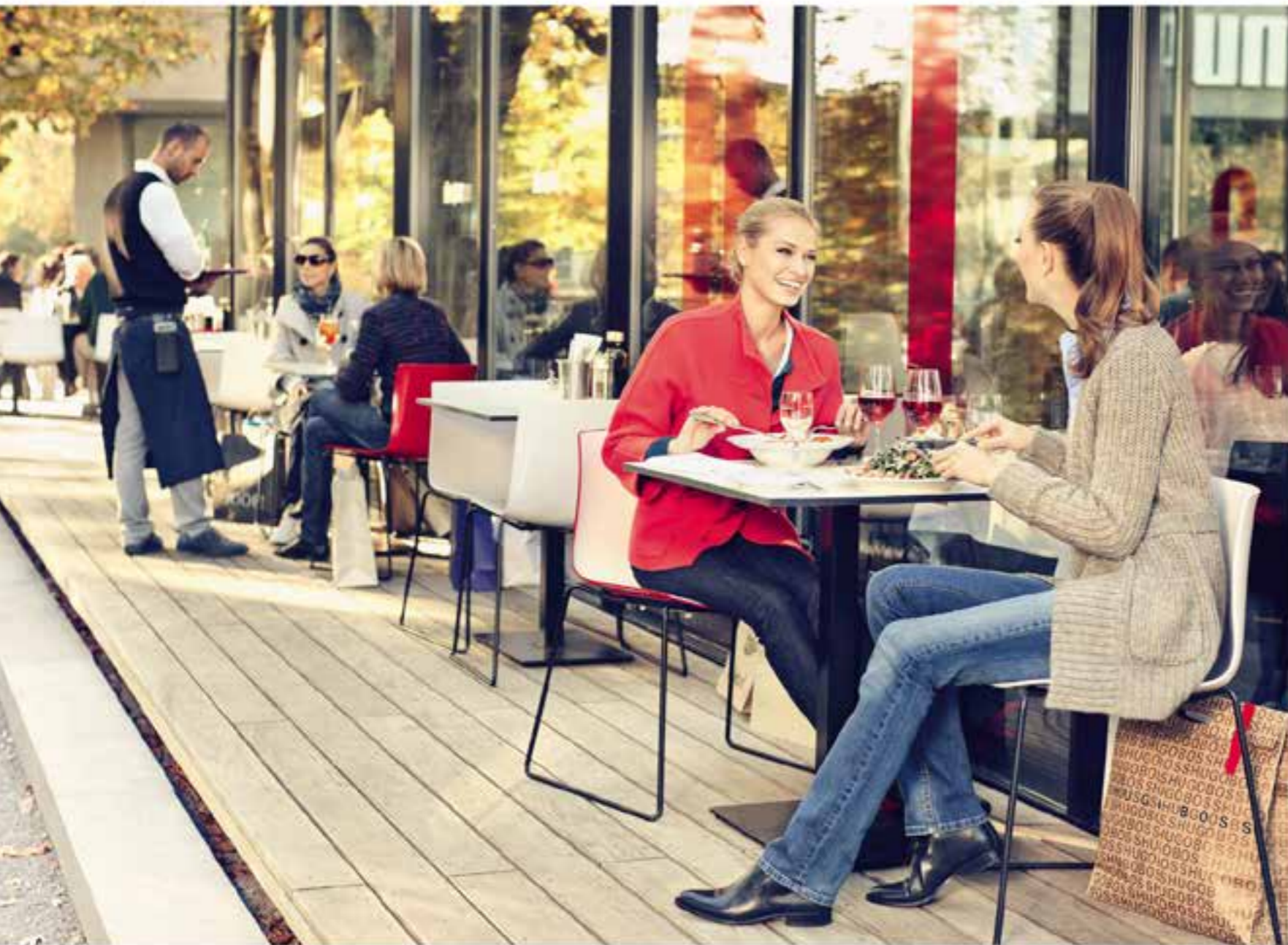
Отдых от шопинга на берегу реки Эрмс в ресторане Ristorante olio e rane