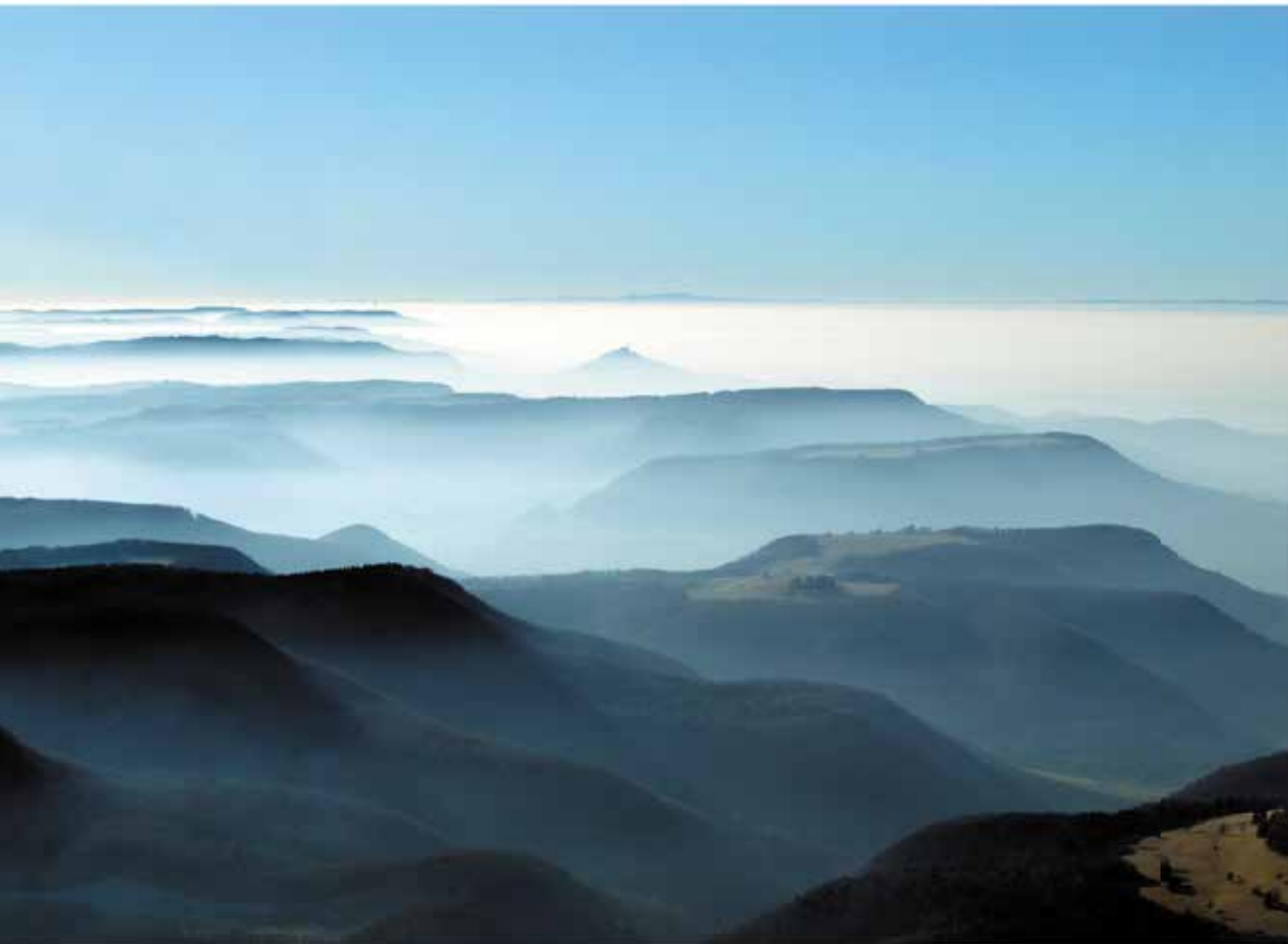
Окружение как картина: обрыв на склоне Швабского Альба