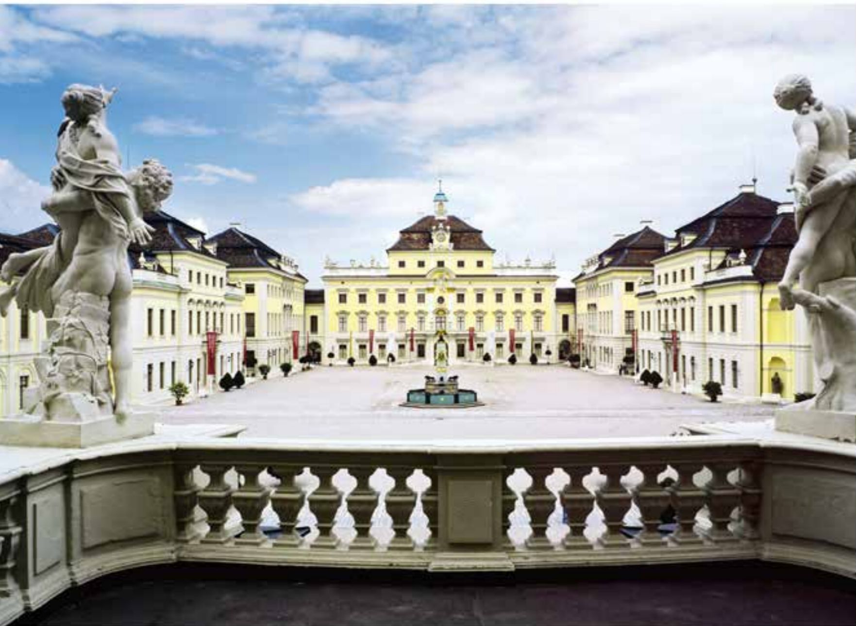
Путешествие во времена барокко: замок Людвигсбург