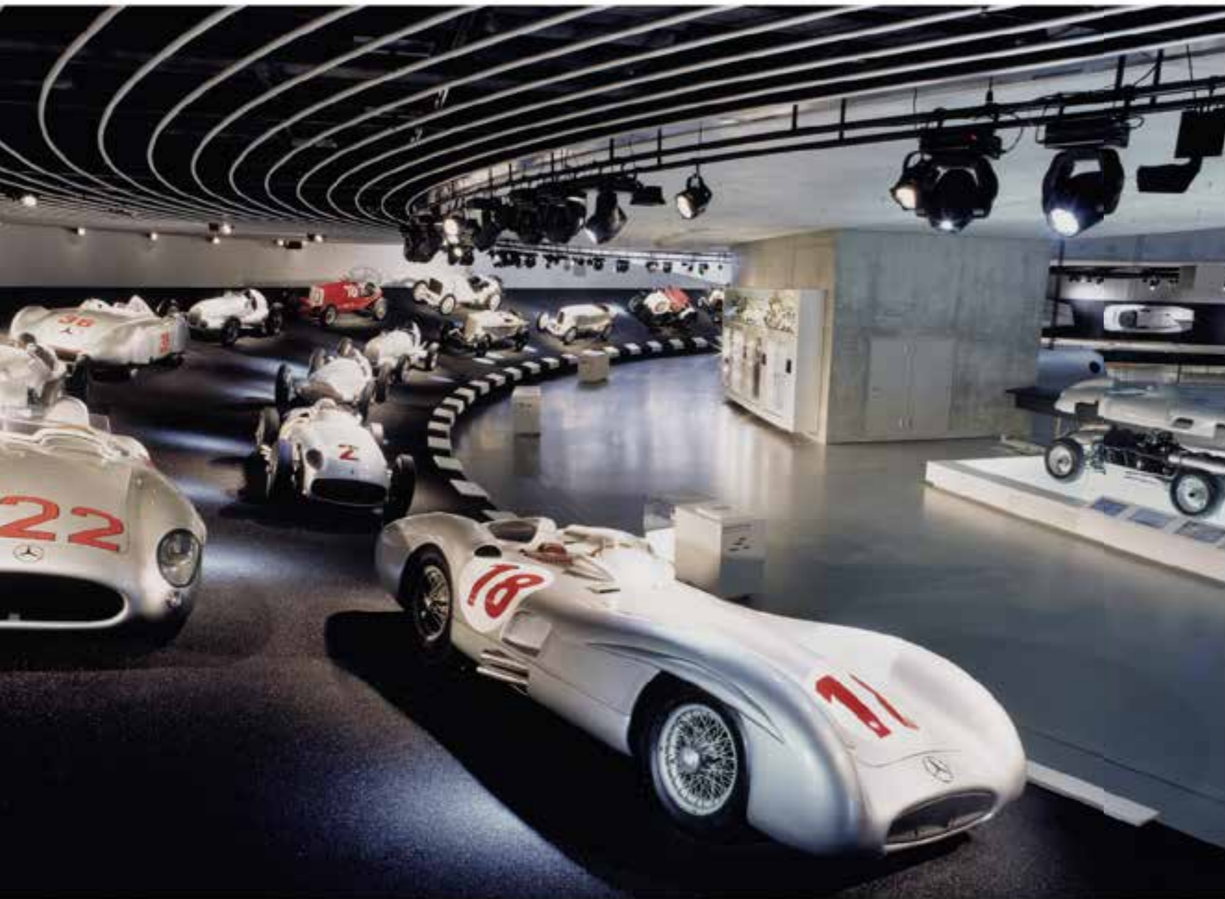
Увидеть историю развития автомобиля можно в музее Mercedes-Benz