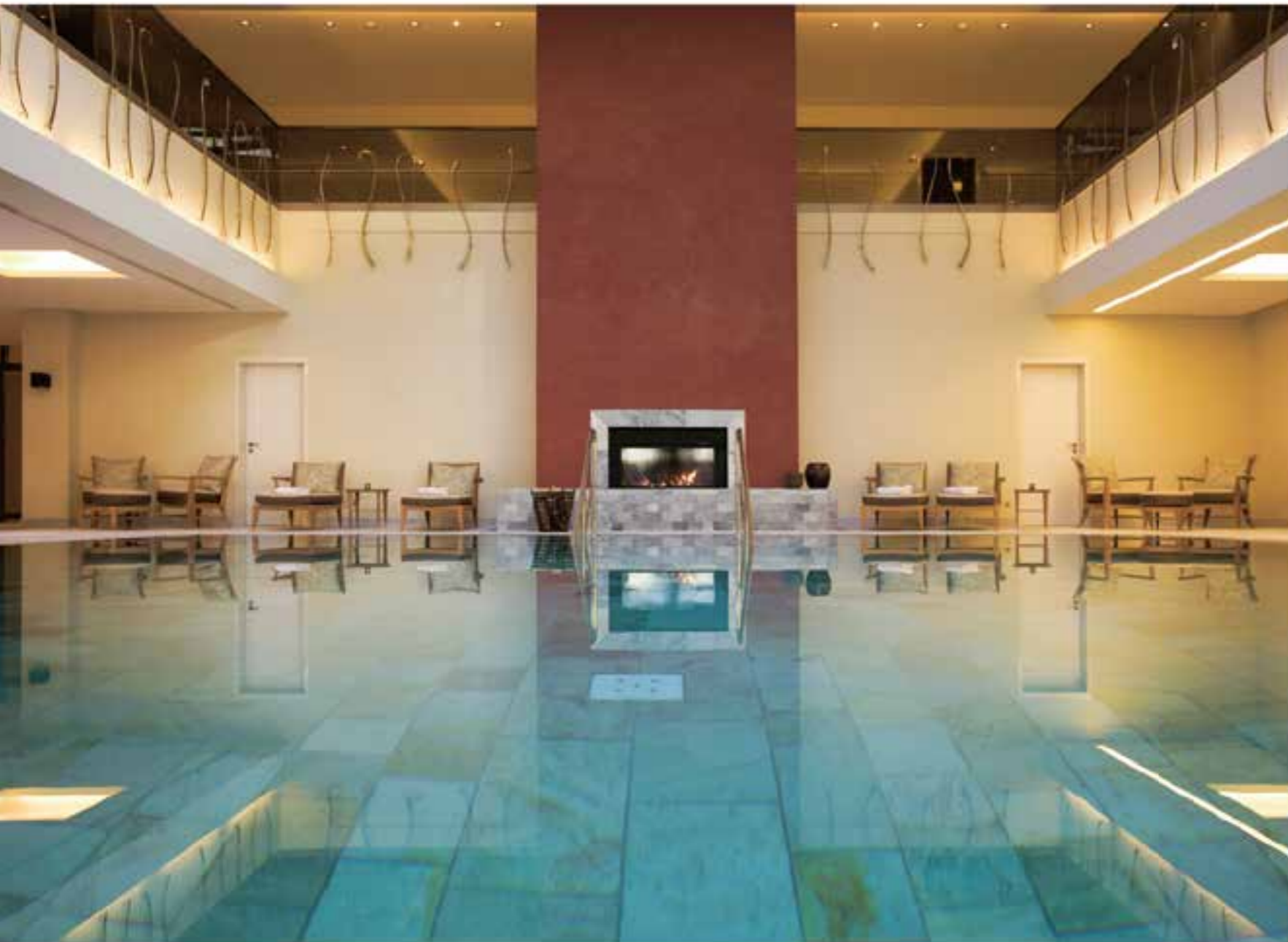
Изысканные СПА-процедуры в отеле Wald & Schlosshotel Friedrichshöhe