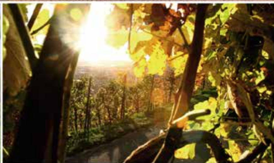
Метцинген окружен виноградниками и фруктовыми садами, что создает идиллическую атмосферу