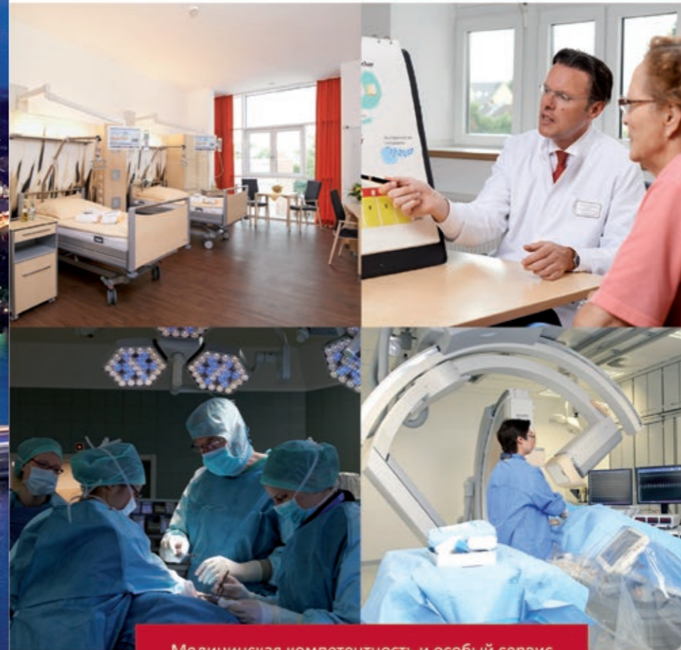
Медицинская компетентность и особый сервис