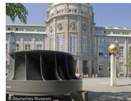
Немецкий музей – Deutsches Museum visitorservice@deutsches-museum.de http://www.deutsches-museum.de/en

В начале этого красивого маршрута во внутреннем дворе музея Deutsches Museum стоит большая сфера, символизирующая Солнце. Далее вдоль восточного берега реки Изар «разместилась» Меркурий, Венера, Земля, Марс, Юпитер, Сатурн, Уран, Нептун и, наконец, карликовый Плутон у входа в зоопарк. Это своеобразная модель Солнечной системы, где можно оценить в сравнении размеры Солнца и планет, а также относительные радиусы их орбит. Каждая остановка на этом пути