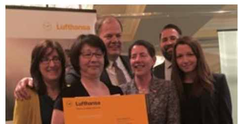
06-2015 Мероприятие для туристической индустрии, Ванкувер