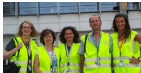
08-2015 Ознакомительный тур, Словения