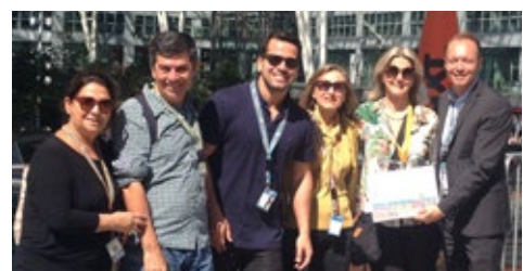
08-2015 Ознакомительный тур Национального туристического офиса Германии, Бразилия