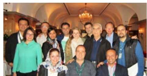
05-2015 Ознакомительный тур Mahan Air