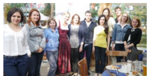
06-2015 Центральноевропейский воркшоп