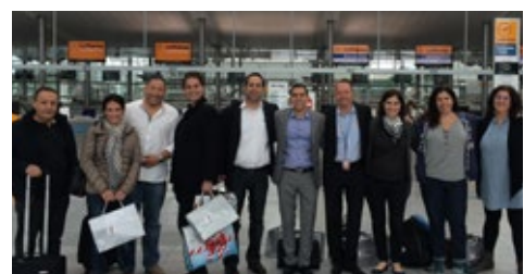
05-2015 Ознакомительный тур, Тель-Авив