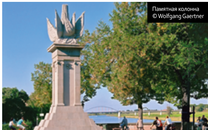
Памятная колонна

От Дрездена 104 км, 52 км от Лейпцига. Время в пути на автомобиле — 1 ч. 45 мин. Примерно столько же по железной дороге.