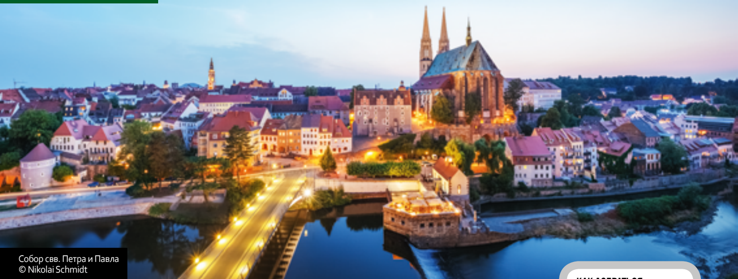
Собор свв. Петра и Павла