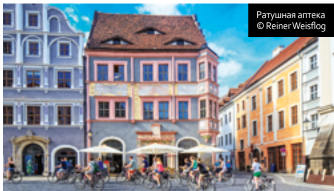
Ратушная аптека

Гёрлиц (Görlitz) — самый восточный город Германии — стоит на реке Нейсе, где с 1945 г. проходит граница с Польшей. На другом берегу (достаточно перейти мост) — польский Згоржелец. Через Гёрлиц проходит 15-й меридиан, по которому определяется центральноевропейское время.