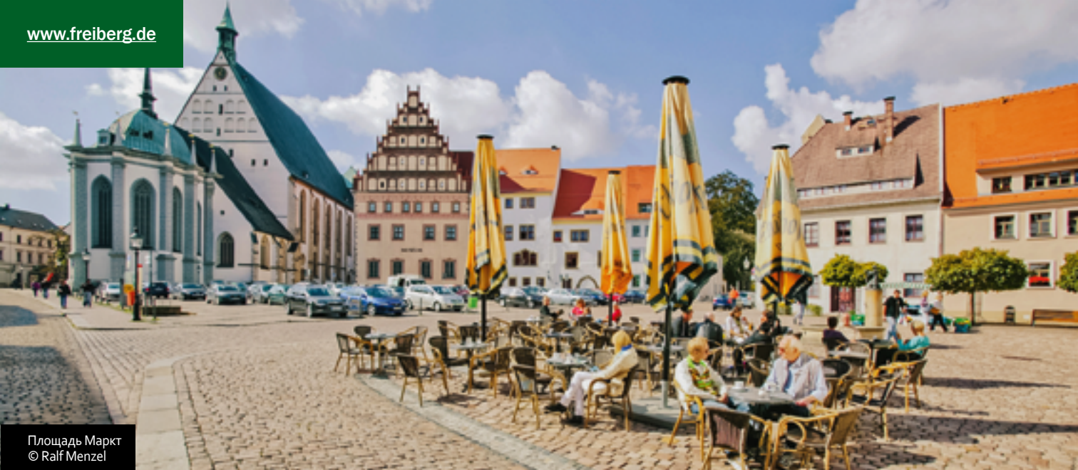
Площадь Маркт