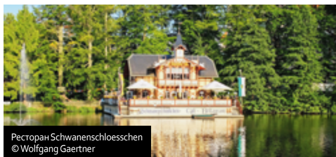
Ресторан Schwanenschloessen

О богатстве Фрейберга напоминают красивые дома аристократов в стиле ренессанс. Многие черты средневековья сохранились — к примеру, крепостная стена. Красив архитектурный ансамбль Старого города. На площади Унтермаркт стоит впечатляющий внутренним убранством Кафедральный собор Св. Марии. Здесь превосходно исполнены поздне-романские триумфальное распятие (Triumphkreuz, ок. 1225 г.), входной портал «Золотые ворота» (Goldene Pforte, ок. 1230 г.) и «Тюльпановая кафедра» в виде фантастического каменного цветка. В соборе находится два органа (одни из лучших в Европе), выполненные знаменитым мастером Готфридом Зильберманном. Здесь регулярно проходят концерты. Площадь Обермаркт окружают красивые дома с высокими черепичными крышами. Недалеко, в замке Фройденштайн (Freudenstein) в сводчатых залах Музея минералов на площади 1500 кв. м представлена коллекция Terra Mineralia — одно из самых больших в Европе частное собрание минералов со всех континентов. В залах выставлено более 3,5 тыс. экспонатов, включая бесподобные драгоценные камни и метеориты от крошечных до очень солидных. Фрейберг и его окрестности были одной из крупнейших серебрянодобывающих областей в Европе. На окраине Фрейберга находится откры-