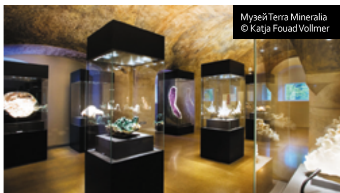
Музей Terra Mineralia

В центре города есть несколько отелей категории 3–4 *, для бюджетного размещения есть неплохой выбор пансионатов и гостевых домов. Всего в городе около 30 отелей и пансионатов.