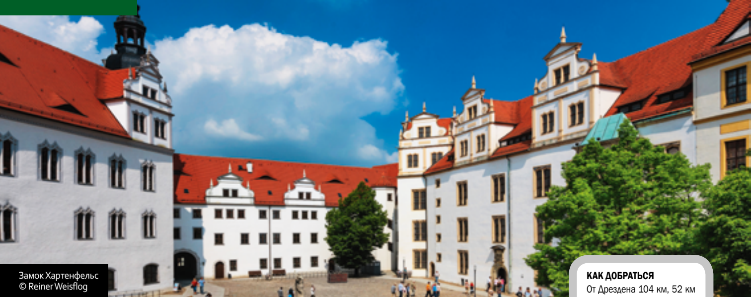
Замок Хартенфельс