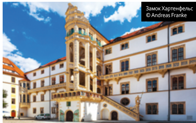
Замок Хартенфельс © Andreas Franke

Представительство по туризму и маркетингу Саксонии в России: