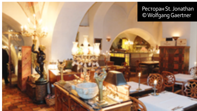
Ресторан St. Jonathan

В городе достаточный выбор отелей категории 3–4*. Буквально рядом с собором находится уютная семейная гостиница Romantik Hotel Tuchmacher, расположенная в здании XVI в.