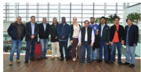
11-2015 «Люфтганза». Фам-трип в Днидиде