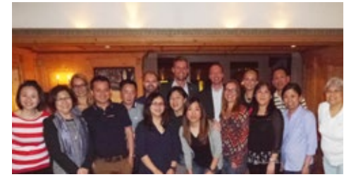
08-2015 Фам-трип Нуала-Лумпур