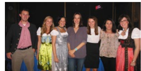
10-2015 «Люфтганза» «Октоберфест». Чикаго