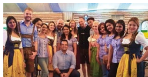
10-2015 «Люфтганза» «Октоберфест». Дубай