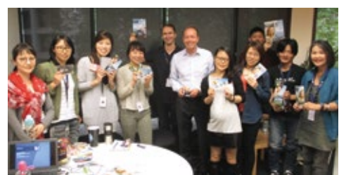
11-2015 «Люфтганза». Тренинг колл-центра в Мельбурне