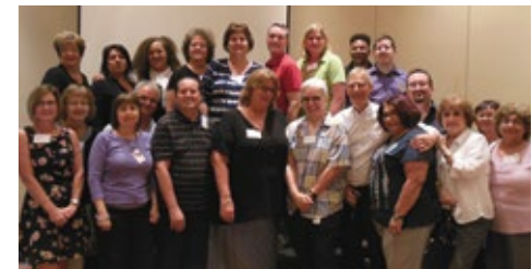
10-2015 «Люфтганза». Мероприятие в Финленде