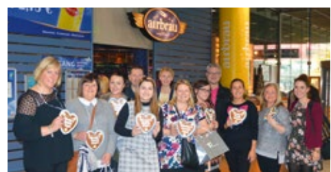
11-2015 Фам-трип Flybe в Хардиде