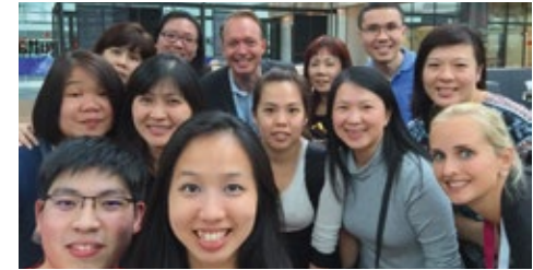
08-2015 Фам-трип Сингапур