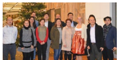
11-2015 MICE-группа Тоа из Китая