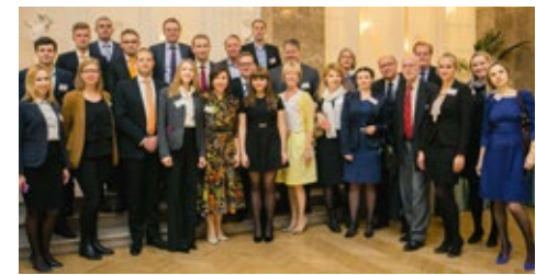
10-2015 DZT роудшоу в России