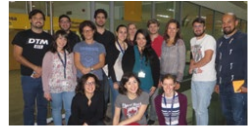
09-2015 «Люфтганза». Тренинг колл-центра в Дублине