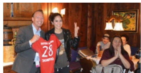
10-2015 Таиландская звезда Nhin Somroo в Мюнхене