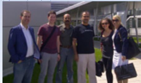
06.2013 Пресс-группа авиакомпании «Люфтганза» из Дубая