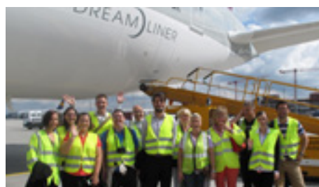
08.2013 Посещение самолета туристическими агентами авиакомпании Qatar Airways