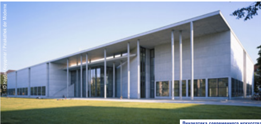
Пинакотека современного искусства