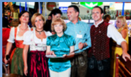
06.2013 Баварский вечер (Киев)