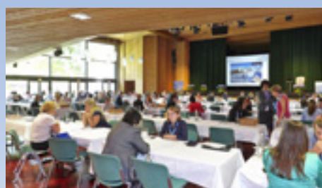
06.2013 Воркшоп для стран Центральной и Восточной Европы (Гармиш-Партенкирхен)