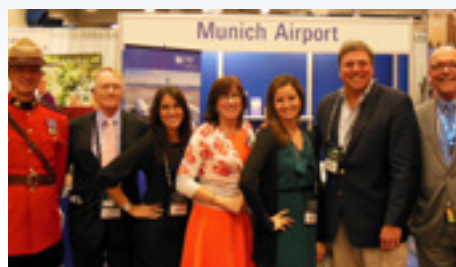
08.2013 Конференция БВТА в Сан-Диего