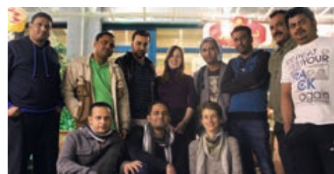
11-2014 Фам-трип в Эр-Рияд