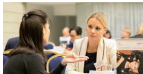
10-2014 Роуд-шоу в Санкт-Петербурге