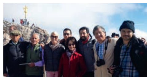
10-2014 Пресс-тур от United Airlines, группа журналистов из Мемфиса