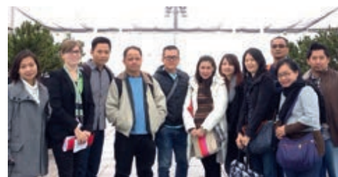
11-2014 Фам-трип в Джайпуре. А/н «Люфтганза»