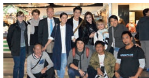
10-2014 Кинокоманда Таиланда