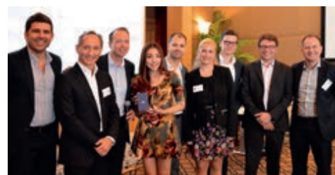
11-2014 MICE. Семинар в Бангкоке