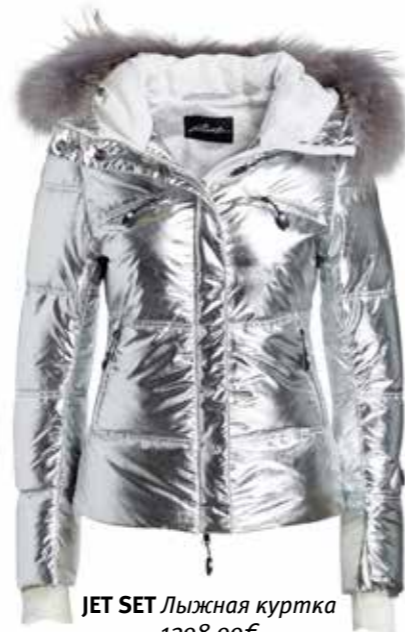
JET SET Лыжная куртка 1398,99€

Tourismusmarketing E. Breuninger GmbH & Co. Marktstr. 1-3, 70173 Stuttgart E-mail: tourismus@breuninger.de