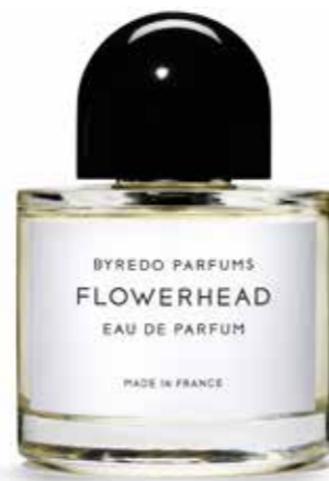
BYREDO Аромат Flowerhead 150,00€